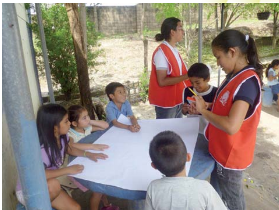
Responsabilidad social. Estudiantes y docentes de Psicología se reúnen para atender llamado de emergencia nacional.

“Como psicólogos tenemos la responsabilidad social de ayudar psicológicamente a los afectados por estos desastres”, destacó.