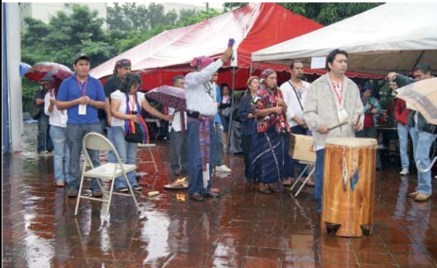
El festival Yulcuicat es inaugurada con una ceremonia ancestral en la que se reza a los cuatro puntos cardinales.

T odos los años, en el mes de octubre, el Departamento de Letras celebra el Festival Indígena que reúne a diferentes comunidades originarias del país.