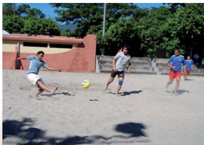
Competiciones. Los estudiantes de Educación Física participaron en las diferentes disciplinas deportivas.