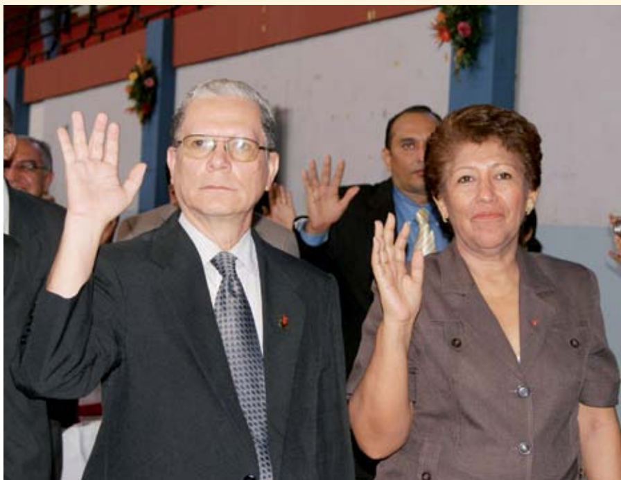
Juramentación. Decano y Vicedecana de la Facultad de Ciencias y Humanidades son electos para el periodo 2011-2015.

Luego la AGU en pleno determinó un espacio para preguntas y respuestas de los candidatos para disipar dudas en relación a los propuestas presentadas.