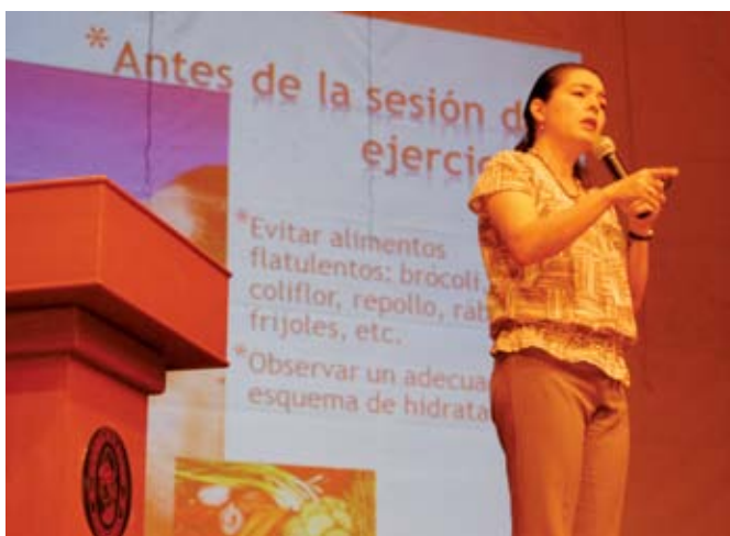
Ciclo de conferencias. Profesionales de la educación física recibieron charlas a fines con la carrera.

Durante el evento se efectuaron competencias en las disciplinas de natación, atletismo, baloncesto, fútbol, voleibol, fútbol de playa, triatlón, fuerza extrema, juegos recreativos y tenis de mesa.